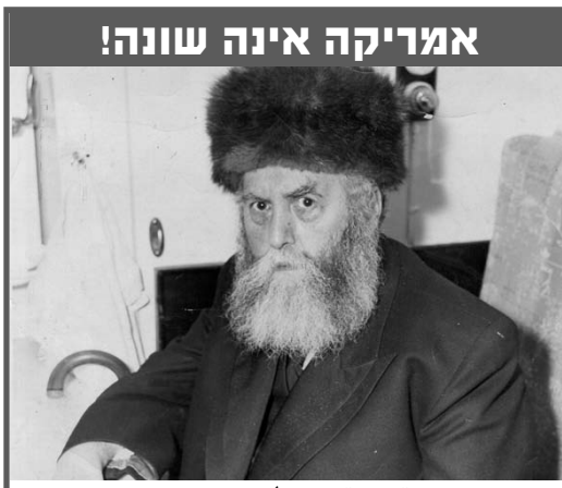
ט' אדר ראשון: אדמו"ר הרי"ץ הגיע לארצות הברית. מייד עם בואו פתח בפעולות להחייאת היהדות ביבשת בהכרזו: "אמריקה אינה שונה".

כאן צריך לציין את חלקם האיום של המפלגות החרדיות המגבות את רה"מ ובפרט ש"ס המהווה חלק מהממשלה ונושאת באחריות לכל מהלכי המסכנים רבבות יהודים. עליה לצאת מיידית מהממשלה ולהצטרף למאבק על הצלת עם ישראל. וכעת זה הזמן.