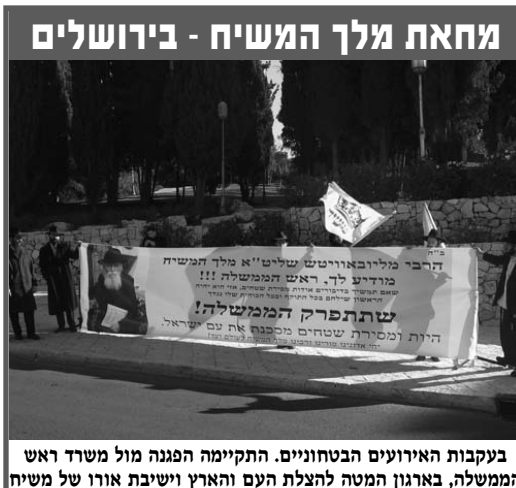
בעקבות האירועים הבטחוניים. התקיימה הפגנה מול משרד ראש הממשלה, בארגון המטה להצלת העם והארץ ושיבת אורו של משיח

בסיום פרשת שמות, פרשת השבוע שעבר, עם התגברות גזירות