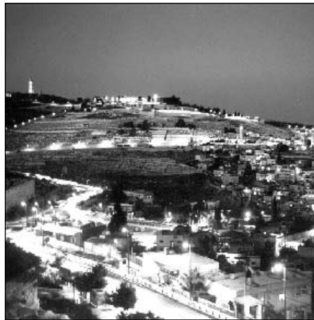
"ירושלים אורו של עולם"

למעשה, לאורך כל השנה אנו מקבלים את ברכתיו של הרבי שליט"א מלך המשיח