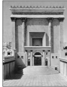
שערי ניקנור בבית המקדש

בהקשר לשאלה מי וכיצד יבנה בית המקדש השלישי, קיימות שתי דיעות, הנראות כסותרות לכאורה זו את זו.