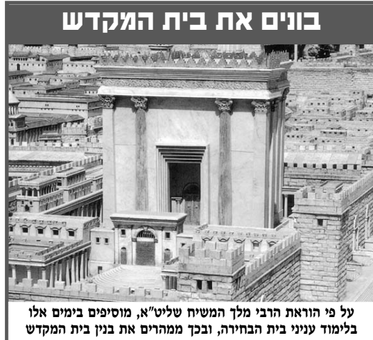
על פי הוראת הרבי מלך המשיח שליט"א, מוסיפים בימים אלו בלימוד עניני בית הבחירה, ובכך ממהים את בנין בית המקדש

אבל היה גם מי שראה את זה אחרת. "ומיכל בת שאול נשקפה בעד החלון ותרא את המלך דוד מפזז ומכרכר לפני ה' ותבו לו בלבה". אך לא רק בלבה, אלא גם בפיה: "ותצא מיכל בת שאול לקראת דוד ותאמר (=בציניות) מה נכבד היום מלך ישראל אשר נגלה היום לעיני אמהות עבדיו כהגלות נגלות אחד הרקים".