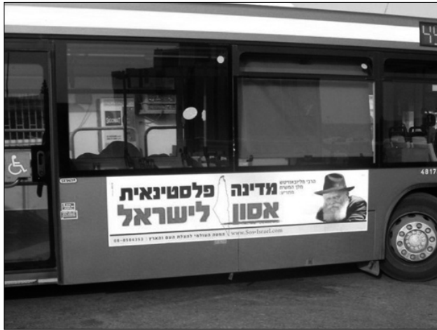
זעקת מלך המשיח בחוצות העיר