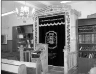
פנים ביהכ"ס. פרוכת ארון הקודש עם "יחי"

עניתיו לו "רק תדע שכתוב "ולמלשינים אל תהי תקוה". אתה הגעת לכאן משום שחברך הלשין בפניך ועכשיו אתה מאיים שתלשין, אז דע לך ש"ולמלשינים אל תהי תקוה" וסגרתי בפניו את הדלת.