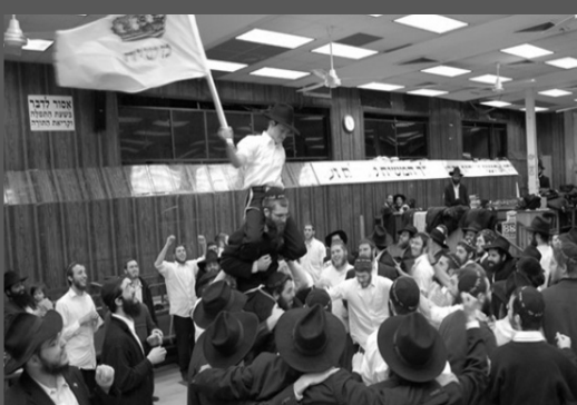
על פי הוראת הרבי שליט"א מלך המשיח, ממשיכים, גם לאחר פורים בריקודי השמחה. בתמונה: הריקודים בבית הכנסת 770, ניו יורק