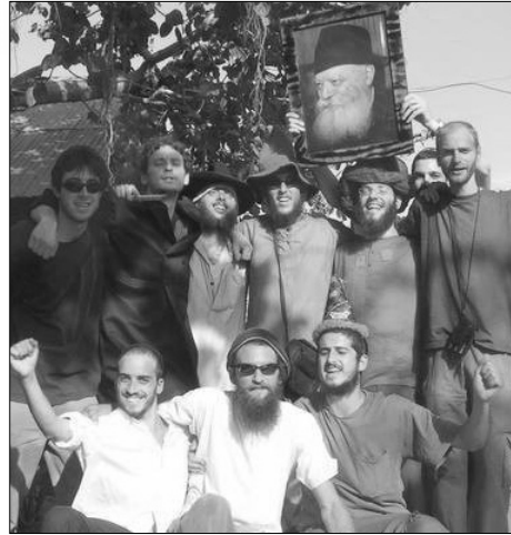
שמחה וריקודים בפורים בבית חב"ד בפושר

בבתי חב"ד ניתן לערוך קבלת שבת, לחגוג את חגי ישראל ולאכול אוכל כשר, מתקיימים גם שיעורים קבועים, קורסים, סדנאות ומפגשים אישיים עם השלוחים. לחלק מהנציגויות נשלח רב מלווה באשתו ובילדיה, ובאחרות נמצאים רק "בחורים" - צעירים רווקים. השלוחים משתייכים לחסידי חב"ד ומאמינים שהרבי חי, ונמצא "בגופו ובנשמתו" בבית הכנסת המרכזי בחצרו בברוקלין (המכונה 770 על שם מספר הבית). בעיניהם הוא המשיח שעתיד לבוא במהרה בימינו ולגאול את היהודים עוד בדור הזה".