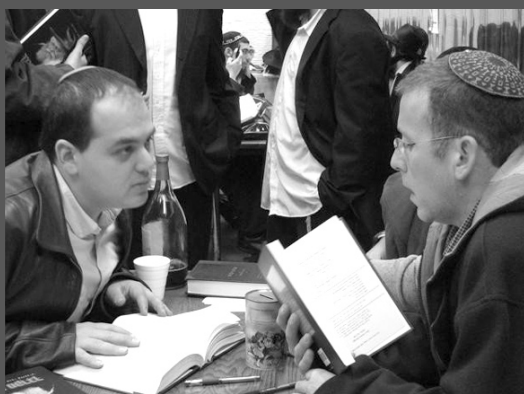
קבוצת עיתונאים דתיים ביקרה לאחרונה ב-770 "בית משיח", לאחר סיור במקום הם כתבו לרבי שליט"א מלך המשיח