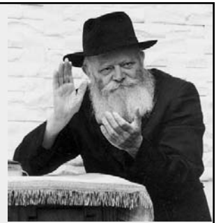
יחי אדוננו מורנו ורבינו מלך המשיח לעולם ועד!

ברב שירה זמרה * הסעות מרחבי הארץ * מולטימדיה * כרטיסים בקופות היחל