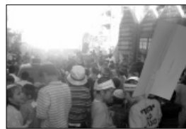
מאות ילדים בתהלוכה. מימין: מתנפח בצורת "770"

הצלחה מופלאה ראינו גם בתהלוכת ל"ג בעומר כאשר למרות סגנון תושבי השכונה, והתחזיות הפסימיות שליוו אותנו לפני כשלוש שנים בתהלוכה הראשונה, הופתענו מכמות הילדים שהשתתפו בתהלוכה. התברר כי גם לתושבי קרית משה אין כל בעיה עם ההצגה על מלכותו של הרבי שליט"א מלך המשיח,