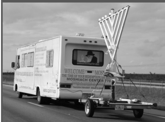
חג החנוכה נוצל ע"י שלוחי הרבי שליט"א מלך המשיח, ברחבי העולם, להפצת בשורת הגאולה והגואל. בתמונה: ה'טנק' בפלורידה

התרחשותו של מהלך אסטרוטגי ניסי בלתי צפוי לחלוטין, כאשר בכוחות האוייב נוצר בלבול ופרצו מהומות ועד אשר החלו להלחם זה עם זה. כך זה היה במלחמת גדעון במדין, במלחמת יונתן ושאל נגד הפלשתים, במלחמת יהושפט נגד עמון, מואב ועמלק, וכלשון הנביא ישעיהו "וסכסתי מצרים במצרים ונלחמו איש באחיו ואיש ברעהו עיר בעיר וממלכה בממלכה".