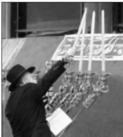
חלקת נר חנוכה ב"770"