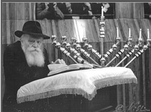
הרבי שליט"א מלך המשיח בהדלקת נרות חנוכה בבית מדרשו ב"770" בניו יורק. קני המנורה אלכסוניים כקני מנורת המקדש.