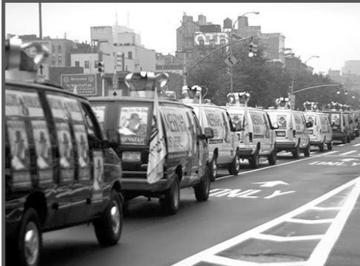
עם סיומם של חגי תשרי ותחילה העבודה בעולם, יזמו הת' ב-770, שיירת "טנקי המצוות" טנקי הגאולה לחוצות מנהטן.