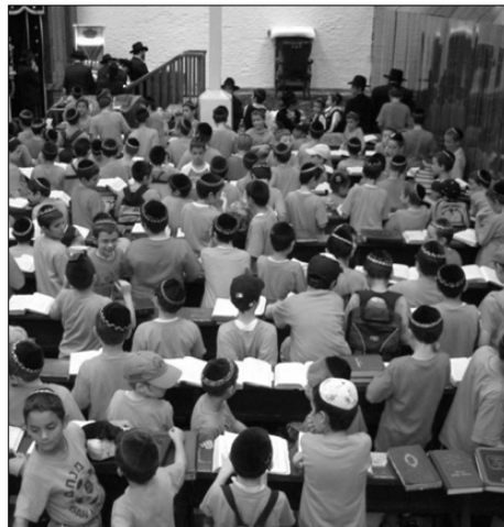
כינוס ילדי ה"קעמפים" ב-770 שבני יורק

בתי חב"ד הממוקמים בצפון לא איבדו את העשתונות, ובמקביל להערכות לקראת חלוקה יומית של מצרכי מזון ליושבים במקלטים, נערכו להעלת הילדים. מדריכים ומדריכות נקראו