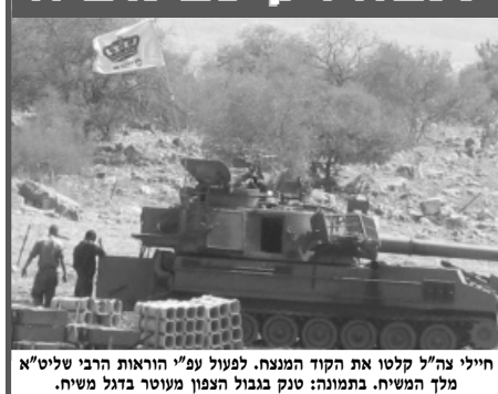
חיילי צה"ל קלטו את הקוד המנצח. לפעול עפ"י הוראות הרבי שליט"א מלך המשיח. בתמונה: טנק בגבול הצפון מעוטר בדגל משיח.

שמאות אלפים נאלצו לנטוש את בתיהם, מי דרומה ומי מקלטה, כאשר מליוני יהודים גילו לפתע את חידלונה של המדינה לאבטחת קיומם, אך טבעי היה לשמוע שוב ושוב את השאלה "נו, מה יהיה הסוף? מה אומר הרבי על המצב?"