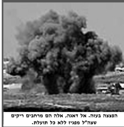
הפצצה בעזה. אל דאגה, אלה הם מרחבים ריקים צצה"ל מפגיז ללא כל תועלת.

כבר מזמן לא שמענו איומים כמו אלו שנשמעו מפיו של עמיר פרץ: "כל מי שיגרומ לכך שהחייל ייפגע שידע דמו של החייל בראשו ובראש מנהיגיו". או כמו אלו שנשמעו מפי רה"מ: אנחנו נגיב וזאת תהיה תגובה רבת עוצמה. זאת לא תהיה פעולה של יום או יומיים". או זו של חיים רמון: "ישראל תחסל כל מי שמעורב בטרור".