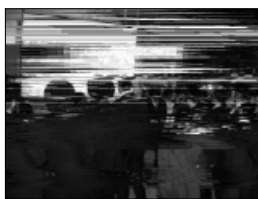
צופים בוידאו בסמוך

מכאן ואילך כל מה שנותר לנו הוא לאסוף את המופתים שתקצר היריעה מלהביאם בפרוטרוט. אחד הסיפורים המרגשים ארע בדקות הראשונות לבואנו, כשעשרות סקרנים עדיין הססו האם