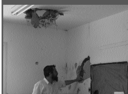
השבוע ניצלו בנס תלמידי ישיבת נתיב מאיר כשקאסם פגע בכיתה ריקה בזמן שהתלמידים סיימו להתפלל שחרית בסמוך.

יחי אדוננו מורנו ורבינו מלך המשיח לעולם ועד