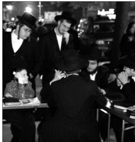
מקשיבים להסבר בדוכן

תוך כדי שיחה מעלה אחד הנוכחים את דברי הרבי הקודם, אדמו"ר הרי"צ: "אמריקה איננה שונה". הרעיונות מתגלגלים במהירות, "בואו נצל היום בערב לטקס ההדלקה המרכזי בשכונה החרדית בורו פארק הסמוכה". בירור קצר מעלה כי מדובר במבצע לא פשוט, כמות האנשים העצומה שמגיעה למקום מצריכה הרכב גדול של