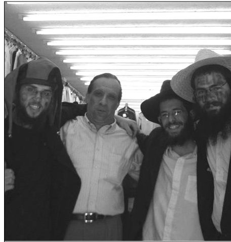
במסיבת פורים עם שגריר ישראל במקסיקו