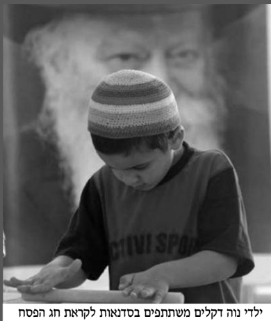
ילדי נוה דקלים משתתפים בסדנאות לקראת חג הפסח