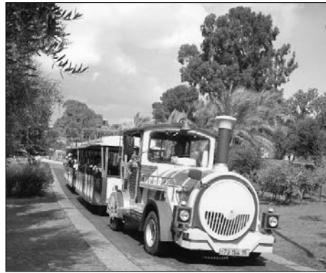
הילדים ברכבת הגאולה בפארק רעננה