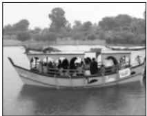
שיט בספינת הגאולה

לפני כחודשיים התקיימה בהצלחה "שבת נופש וסמינר חינוך", בחפץ-חיים, כאשר המשתתפים זוכים לשבת מהנה גם בתחום הגשמי: המנוחה והאוכל, וגם בתחום