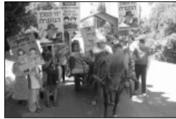
תהלוכת ל"ג בעומר

הדפסת ספר התניא ב"ט כסלו, היוותה שלב חשוב עבורנו ועבור הישוב. השתתפו במעמד מאות תושבים שחשו כי מדובר במעמד רוחני מיוחד. לאירוע הגיעו חברים רבים משיבת חב"ד ברמת אביב. למדנו מהדפים הראשונים וקיימנו התוועדות מרשימה. אגב, כל בית במושב קיבל עותק אחד מספר התניא שהודפס.