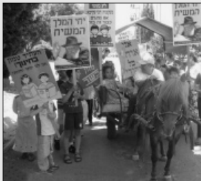
תהלוכת ל"ג בעומר בבר גיורא

פרנסתו, משום שטענה זו יכולה להיות, במידה והולכים בכוחות עצמו, אבל היות וזו שליחות מהקב"ה, שהוא הכל-יכול, במילא נופלים כל המניעות והעיכובים".