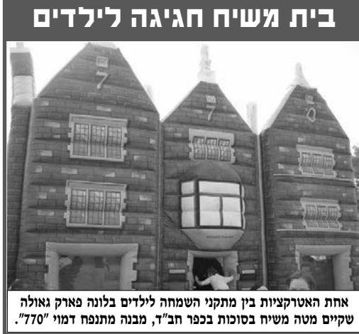
אחת האטרקציות בין מתקני השמחה לילדים בלונה פארק גאולה שקיים מטה משיח בסוכות בכפר חב"ד, מבנה מתנפח דמוי "770".

המספרי (גימטריא) של שם 'אלוקים' = 86 זהוה לערך המספרי של המלה 'הטבע' = 86.