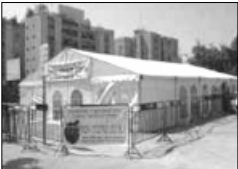
אתר התפילה לחגים

אולי יאה זה המעשה שיכריע את הכף ונזכה כלנו לגאולה האמיתית והשלמה עכשיו ממש.