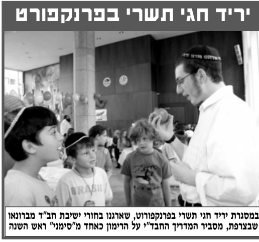
במסגרת יריד חגי תשרי בפרנקפורט, שארגנו בחורי ישיבת חב"ד מברונאו שבצפת, מסביר המדריך החב"די על הימון כחמד מ"מינני" ראש השנה

במהלך השנים רק מלא וגדוש ועמוס יותר במשימות של "וילך", להוסיף בלימוד תורה, הידור בקיום המצוות בכמות ובאיכות, כל אחד לעצמו יחד עם הפעילות למען הזולת, להוסיף כל העת בקבלת החלטות טובות, כאשר לכל לראש הוא מיישם זאת בעצמו ורק אח"כ דורש