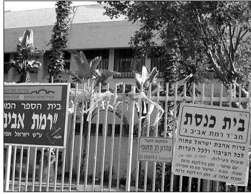
כאן החל ה"מניין" המקורי ברמת אביב