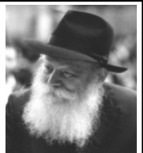
מעמד התאחדות עולמי בשידור חי מ 770 ניו יורק