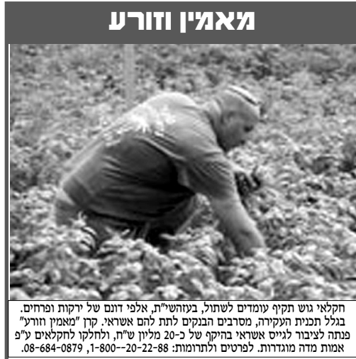
הקלאי גוש תקיף עומדים לשחול, בניהושי"ת, אלפי דונם של יקות ופרחים. בכל תכנית העקירה, מסרבים הבנקים לתת לחם אשראי. קרן "מאמין חורעי" נפתח לציבור לגייס אשראי בהיקף של כ-20 מליון ש"ח, ולחלקו לחקלאים ע"פ אמות מדה מוגדרות. לפרטים ולתרומות: 08-684-0879, 1-800-20-22-88.

"תכנית הפינוי נולדה כי שרון היה משוכנע שעדנה ארבל תגיש נגדו כתב אישום". "ההחלטות על