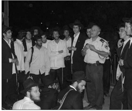
הת' מעודדים את חבריהם העצורים

שלב השיא היה כאשר, הרב זמרוני נעמד מול תאייהם של התמימים והכריז בקול נישא: "אנו חיילי בית דוד, חיילי הרבי שליט"א מלך המשיח. צריכים לזכור את ה"יוחן שם ישראל נגד ההר", עלינו להתאחד בהפצת בשורת הגאולה ובמאבק על שלימות הארץ, סביב הרבי שליט"א מלך המשיח, אשר בקרוב ממש נזכה להתגלותו המלאה ומושלמות. ושוב בסיום דבריו נערכה הכרזת "יחי" משותפת עם הת' בתאי מעצרים.