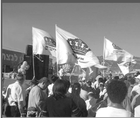
עצרת ההזדהות בשוב חומש בצפון השומרון בחול המועד פסח