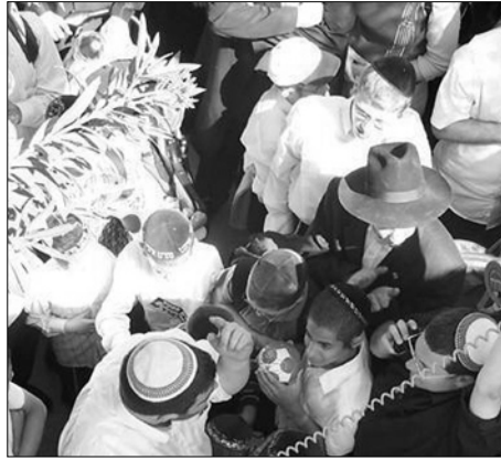
מקבלים תידוך באחד הישובים

את המפגש העוצמתי עם נחישות יהודית חתמו מספר החלטות טובות: הקמת גרעין חב"ד בישוב חומש, פתיחת "ישיבת בין הזמנים" לתמימים ו"שבת שכולה משיח" למתיישיבי צפון השומרון. טל' לפרטים: 057-774-0670.