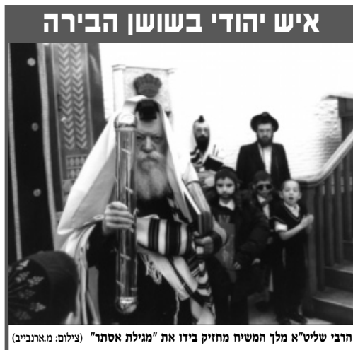
הרבי שליט"א מלך המשיח מחזיק בידו את "מגילת אסתר"

שבועות מספר לאחר מכן. ברוקלין, ניו יורק. התוועדות פורים עם הרבי שליט"א מלך