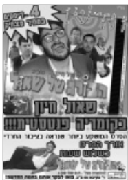
הבורג של שאול

הסרט מבוסס על סיפור אמיתי, על ילד מתמיד שביקש מאביו לרכוש לו ספרי לימוד במקום אירוע חגיגי, אלא שהאב נכנס למצוקה כלכלית והספרים לא מגיעים. הילד "נשבר" ומתאשפז ואז מגיע "שולי". במקביל, הישיבה שוקעת בחובות נכנס לתמונה ומגיעים למשפט. לשם כך נערכים צילומים בבית המשפט המחוזי בת"א. גם בית הרפואה 'שיבא' מפנה מחלקה שלמה לצורך צילומים.