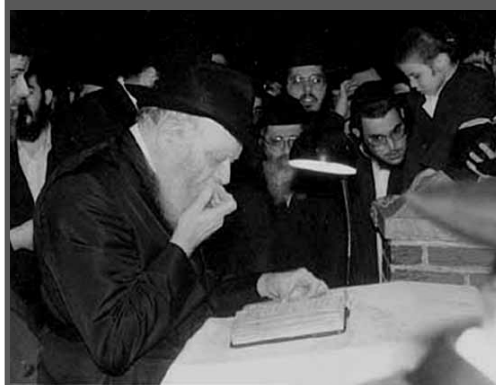
הרבי שליט"א מלך המשיח במעמד קידוש לבנה. בקיומה של מצוה זו, אנו מבטיחים את התחדשותה של מלכות דוד בקרוב ממש

וזהו לשון הכתוב: "ויהי בארבעים שנה.. הואיל משה באר את התורה הזאת", מפרש רש"י ואומר: "בשבעים לשון פירשה להם". לא לשפה אחת או שתיים אלא לשבעים לשון, לכל אומה ואומה בלשונה.