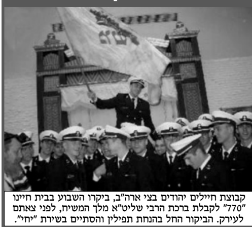
קבוצת חיילים יהודים בצי ארה"ב, ביקרו השבוע בבית חייו "770" לקבלת ברכת הרבי שליט"א מלך המשיח, לפני צאתם לעירק. הביקור החל בהנחת תפילין והסתיים בשירת "יחי".