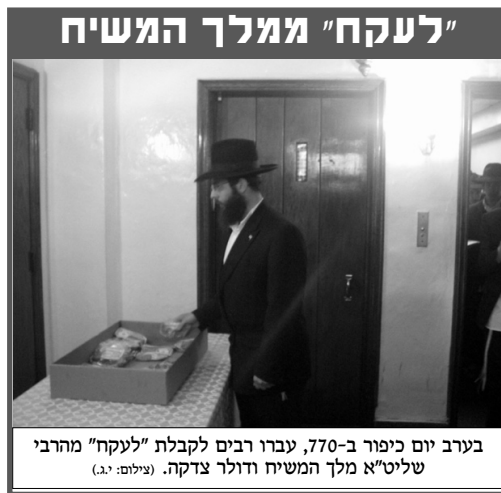
בערב יום כיפור ב-770, עברו רבים לקבלת "לעקה" מהרבי שליט"א מלך המשיח דולר צדקה.

ומעל לכל שמחות אלה ישנה השמחה ב"הקפות" לשמיני עצרת ושמחת תורה: "שישו ושימחו בשמחת תורה". שמחה המקיפה את כל העם, ובפרט ב"הקפות" בבית חינו - מקור השמחה.