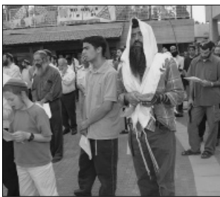
עצרת תפילה בגוש קטיף משלם שכרם.

נטלתי לידי את כרד ה' ושמתי בתוכו את הפתק. התשובה התקבלה בעמוד ר- רא' במכתב באידיש, אך מתוכו בלטו לנגד עיני המילים "וכל מי שעוסקים בצורכי ציבור באמונה, הקב"ה משלם שכרם".