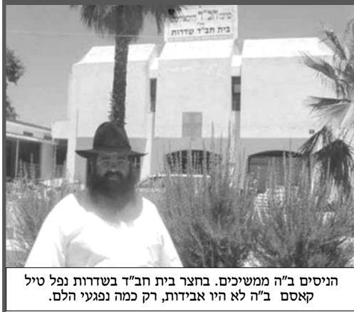
הניסים ב"ה ממשכיכם. בחצר בית חב"ד בשדרות נפל טיל קאסם ב"ה לא היו אבידות, רק כמה נפגעי הלם.

תיאור פסיכולוגי, של אדם שהצדקה היחידה למעשיו, זו העובדה שהוא, הוא, החליט ומכיון שהוא החליט, "כי בשרירות לבי אלך", הרי בוודאי שזהו הנכון.