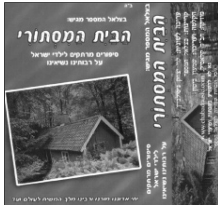
חזית הקלטת החדשה

בתוכנית לעתיד, בעזרש"ת, להפיק קלטות וגם דיסקים באיכות גבוהה ביותר. לקלטות נקבע מחיר זול והן מיועדות למוסדות וגני ילדים. טל' להזמנות: 066-505-583.