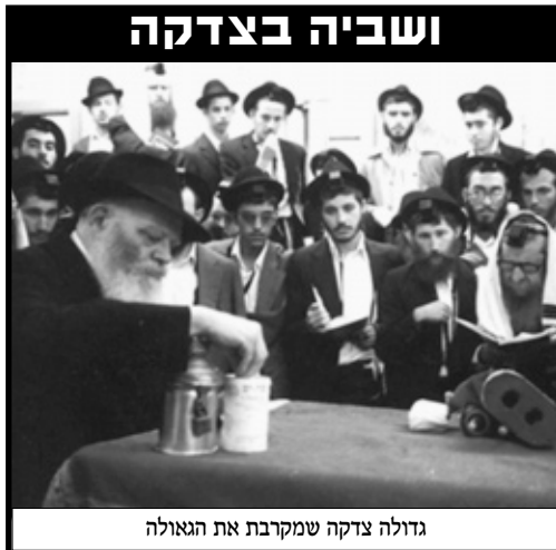
גדולה צדקה שמקרבת את הגאולה

עשרת הדברות חודרים את הבריאה כולה, כשהם ומכשירים אותה לשלב של "ונגלה כבוד ה' וראו כל בשר יחדיו" בקרוב ממש.