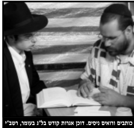
כותבים ורואים ניסים. דוכן אגרות קודש בל"ג בעומר, רשב"י

בכינוס הארצי שיתקיים אי"ה ביום שני ב' תמוז, ניתן יהיה להעזר באותם דוכנים שיהיו באמפיאטרון בבת ים.