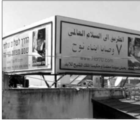
102 שלטים שהוצבו בישובים הערביים

ראש המועצה שחתם את מסכת הנאומים הפתיע, כשאמר כי הוא מתרגש להתחיל להביא שלמינוי יש מטרה אלוקית. בפני המשתתפים הוצגה תעודה מהודרת בה הקריאה לקיים שבע מצות בני נח. ראש המועצה לא היסס, וחתם על התעודה לקול תשואות הנוכחים.