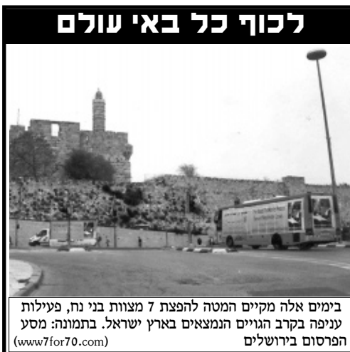
בימים אלה מקיים המטה להפצת 7 מצוות בני נח, פעילות עניפה בקרב הגויים הנמצאים בארץ ישראל. בתמונה: מסע הפרסום בירושלים (www.7for70.com)

נשאלת השאלה והרי בפרשתנו פרשת 'שמיני' לא חסכה התורה, ובכמה וכמה פעמים נאמר הלשון "טמא" או "טמאה" ביחס לבעלי חיים שאינם טהורים. מדוע אם כן, אצל נח מעדנת התורה את הדברים ואילו אצלנו, משתמש משה רבינו בלשון "בוטה" ואומר - זה טמא!