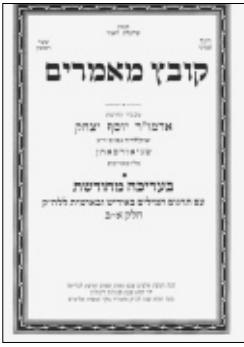
חזית ספר המאמרים החדש

הבטחתי לו שברגע שאדע על משהו שמתכוון להדפיס ספר - לא קונטרס - מאמרי חסידות אשתדל "לשדך" ביניהם.