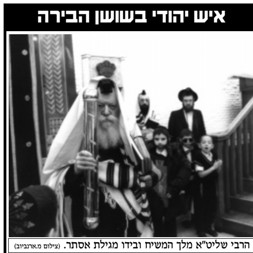
איש יהודי בשושן הבירה

משמים לא אהבו את זה, אבל נתנו עדיין צ'אנס. חיכו, אולי כאן למטה יתעשתו. אולי יצליח מרדכי הצדיק ותלמידיו להעביר את המסר: ההשתתפות בסעודה, הייתה טעות איומה,