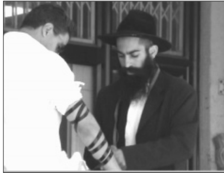
הת' חנו בביוף במבצע תפילין ברמת אביב

התייעצתי, הביט בתשובה שהתקבלה בכרך י"ב עמוד קס"ד-ה וחיווה דעתו חד משמעית "ישיבת חב"ד בארץ הקודש". אכן כבר בראשית המכתב הופיע: "... במיוחד בהנוגע אליו, תלמיד ישיבת תומכי תמימים, אשר רבותנו הנשיאים נתנו להם שם התואר תמים , שבמשך הזמן צריך להעשות גם שם העצם שלהם..".