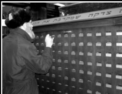
ב-770 בית מדרשו של הרבי שליט"א מלך המשיח, נקבעה קופת צדקה ענקית ובה כ-150 תאים לזיכרון הגאולה האמיתית והשלמה

אלו גם אלו מודעים לכך שהתחמשותם של הכוחות המזוינים הפלסטינים בתחומי הרש"פ תימשך, וכי יכולתה של ישראל להגיב רק תעשה מוגבלת יותר ויותר.