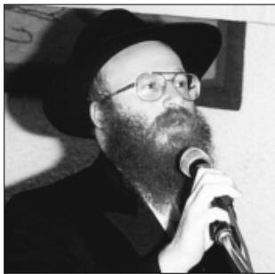
הרב מנחם מענדל פרידמן

כשראיתי את התשובה עודדתי אותו ואמרתי לו שאין לו מה להצטער משום שהרבי כבר ישלם את הכסף.