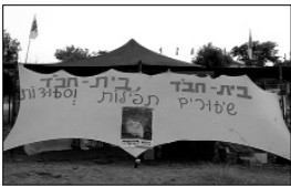
מאהל בית חב"ד בפסטיבל