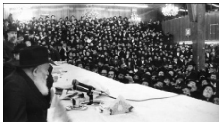
וע"י קריאתו לכל הנבראים: "בואו נשתחוה ונכרעה לפני ה' עושנו" (תהילים צה, ו)

וביאור העניין: בראש השנה - יום הששי למעשה בראשית - גמר בריאת העולם, הסתיים בבריאת כוונת ותכלית כל הבריאה - בריאת אדם הראשון, אשר כבר באותו יום המליך את הקב"ה למלך ע"י אמירתו "ה' מלך גאות לבש" (תהילים צג, א),