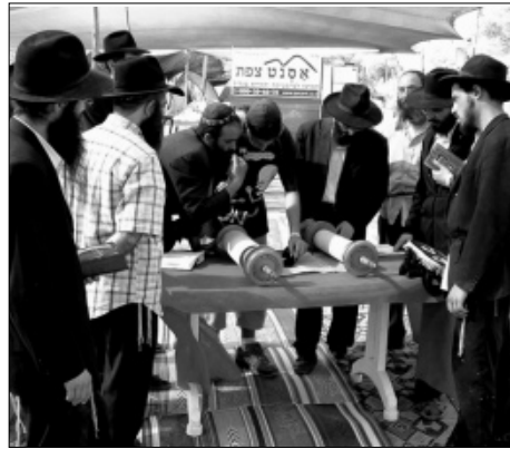
קריאה בתורה בבית חב"ד בפסטיבל

בחג עצמו, יתקיימו א"ה תפילות בבית חב"ד, סעודות חמות, שיעורי חסידות והתוועדויות. ביום השני של ראש השנה, יצאו שליחי הרבי שליט"א מלך המשיח לרחבי הפסטיבל לזכות את אלפי המשתתפים במצוות היום - שמיעת שופר. ובעזרה של שיהיה זה כבר, שופרו של משיח.