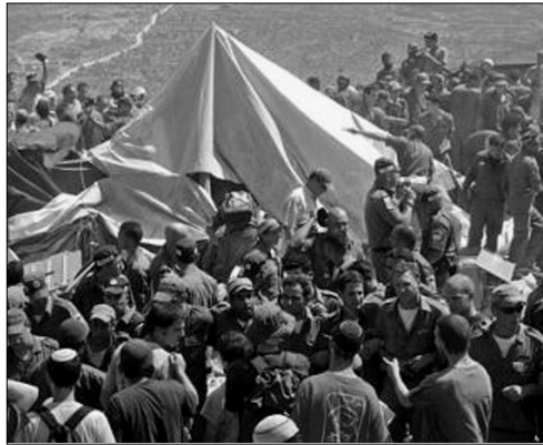
פינוי מאחז מצפה יצהר

תושבי יצהר גם הם מגיעים למאחז, על נשיהם וטפם ומתקשים למראה עיניהם. במקום מתארגן במהירות כינוס צבאות-השם עם אמירת פסוקים. כעת מתיישבים להתוועדות "רעוא דכל רעוין". ומתחילים ב"סדר ניגונים". האורחים והמקומיים מנגנים יחד את "ניגוני רבותינו נשיאינו". החיילים עומדים מעל הבקעה ומביטים בהתרגשות... תפילת מעריב והבדלה לאחריה חוזרים לבית סנדרוי לצילום קבוצתי ולריקוד סוער של "יחי".