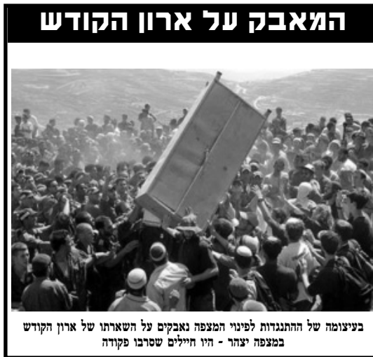
ביציגומה של ההתנגדות לפינוי המצפה נאבקים על השארית של ארון הקודש במצפה יצחר - היו חיילים שסרבו פקודה

התוצאות נראו היטב בשטח. ההרס שהותירו היה ונדאלים לשמו. הקפיצו מאוד מאוד שגם הפצים וכלים אישיים לא ישארו שלמים. הרס לשמו. די היה לפריט כלשהו שיתגלגל באקרעי לשטח המאחז, כדי שהוא ישבר או ישרף.