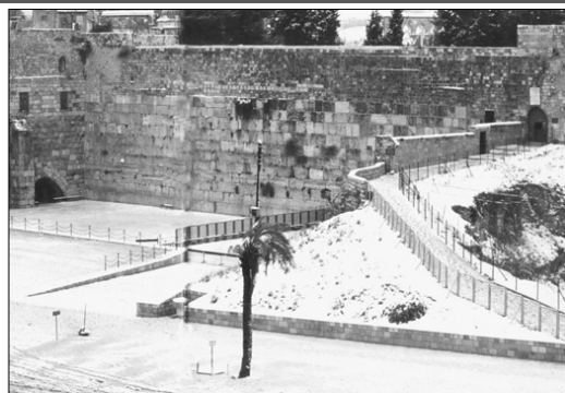
הגשם והשלג ברחבי הארץ גם הם מסימני הגאולה. ובנבואת ישעיהו: "כי כאשר ירד הגשם והשלג מן השמים.. קרובה ישועתי לבוא וצדקתי להגלות".