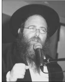
הרב לוי יצחק גינזבורג

גם בגודל ובעוצמת הבטחון בה' ישנו, כמובן, כמה וכמה דרגות. שהרי בדרך כלל נדרש האדם לעשות כל התלוי בו בדרך הטבע וביחד עם זה לבטוח בה'. אך לפעמים ישנו מצב בו נדרשת ממנו הנהגה שלמעלה מהטבע לגמרי, ללא שום חשבונות.