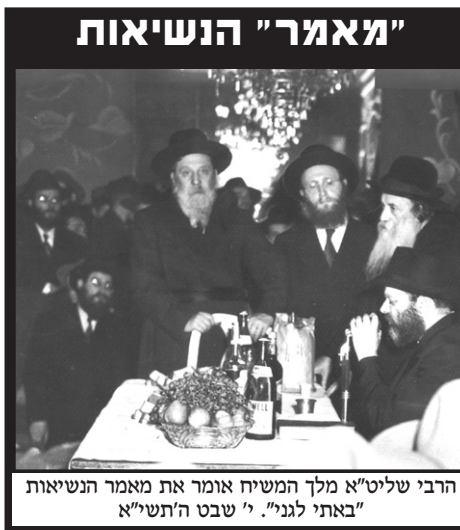
הרבי שליט"א מלך המשיח אומר את מאמרו הנשיאות "באתי לגני". י' שבט ה'תשי"א

וכך היא מנוסחת בתמצית במאמרו י' שבט תשי"א: