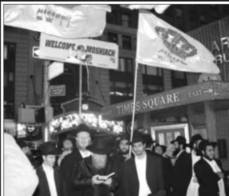
עפ"י בקשת הרבי שליט"א מלך המשיח לקיים את מעמד קידוש לבנה, ברחובה של עיר, יצאו בחורי ישיבת חב"ד המרכזית וערכו את המעמד, בכיכר הטיימס סקוור במנהטן