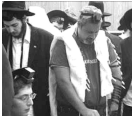
בנימין ציוני השנה בחודש תשרי ב"770"

"את עולמה הפנימי של חב"ד היכרתי לראשונה באמצעות שיעור תניא שמוסר הרב דוד מיפעי מברקת. ה'תניא', 'קנה' אותי מהרגע הראשון". מכאן החלו גם שיעורים נוספים בתורת החסידות ובדבר מלכות. בבבד בבד התחזקה התקשרות אל הרבי שליט"א מלך המשיח אוהב ישראל הגדול.