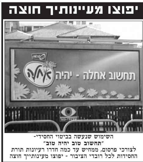
השימוש שנעשה בביטוי החסידי - "תחשוב טוב יהיה טוב" לצורכי פרסום, ממחיש עד כמה חדרו רעיונות תורת החסידות לכל רובדי הציבור - יפוצו מעינותייך חוצה

ומה היא העצה? ממשיך הרבי מלך המשיח שיל"ו ואומר: