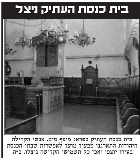
בית כנסת העתיק בפראג מוצף מים. אנשי הקהילה היהודית התארגנו מבעוד מועד לאפשרות שבתי הכנסת בעירו יוצפו ואכן כל תשמישי הקדושה ניצלו. ב"ה.

על ח"י אלול, יום הולדת הבעש"ט ואדמו"ר הזקן נאמר כי יום זה מכניס חיות בעבודת חודש אלול. חיות המעוררת את הנקודה היהודית אצל כל אחד מבני ישראל, את נקודת האחדות והמוכנות לצאת ולהלחם למען הגנתו של כל יהודי ויהודי. והובטחנו ע"י הרבי שליט"א מלך המשיח, אשר מיד עם "כי תצא" זוכים ל-"כי תבוא", דהיינו גאולה אמיתית ושלמה, תיכף ומיד ממש ומתוך שמחה וטוב לבב.