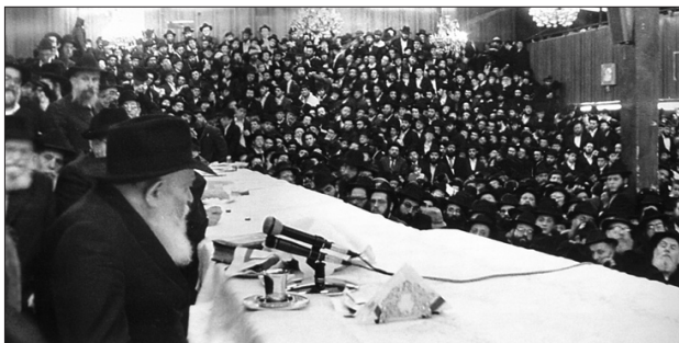
ארבעים שנות התוועדות

לרישום ולהזמנות: בניו יורק: 718-778-8000 שלוחה 275. ובארץ הקודש: 02-500-0388.