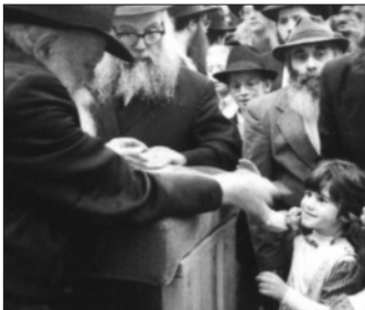
"כשחזרנו, מספרת חיה מושקא, אבא

אושפזתי במחלקה כירורגית. בסיום סדרת הצילומים גילו הרופאים לתדהמתם כי לא נפגעת בראשי כלל. אבי מיד נזכר בחלוקת הדולרים ובמבט המיוחד, לו זכיתי..