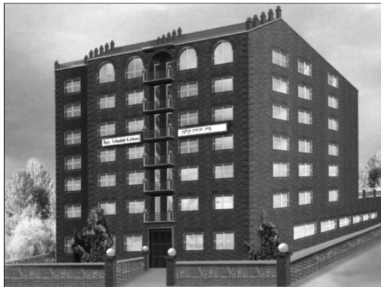
תכנית בניין - הכנסת אורחים

החותם על הוראת קבע בסך $ 18 משתתף בהגרלה כפולה, כאשר בהגרלה הראשונה הפרס הכספי הגדול הוא בסך של $ 100,000 לקניית דירה, וזאת מלבד הגרלה נוספת בה יוגרלו פרסים יקרי ערך. יש לציין כי מי שכבר חתם במסגרת המבצע "קח אורח ל-770" ורוצה להצטרף למבצע החדש, עליו רק להתקשר ולבקש שידרוג בתבנית המבצע.