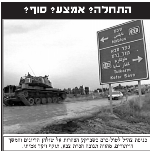
כניסת צה"ל לטול-כרם כשברקע הצהרות על שולחן הדיונים והמשך היותירורים. מהווה תגובה חסרת צבע, תוקף ויעד אמיתי.

אך ללא ספק אנו רשאים לציין עובדות. ואם כן, אזי עובדתית, לשון הפסוק בפרשתנו "ויאמינו בהו" ובמשה עבדו" מופיע לאחר נס עשרת המכות ויציאת מצרים ולאחר נס קריעת ים סוף. שלבים שיש בהם הוכחה מספיקה לכל הדיעות, שניתן להאמין במשה רבינו. ואכן "ויאמינו בה" ובמשה עבדו". ואילו