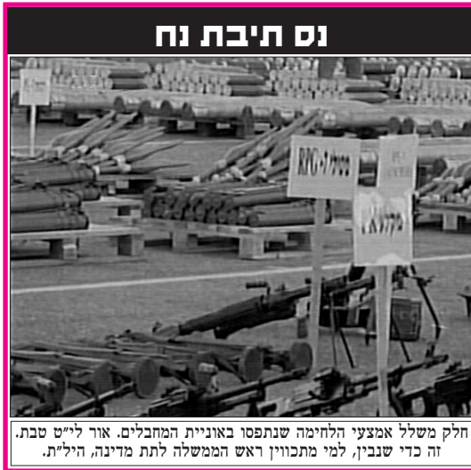
חלק משלל אמצעי הלחימה שנתפסו באוניית המחבלים. אור לייט טבת. זה כדי שנבין, למי מתכווין ראש הממשלה לתת מדינה, היל"ת.

חייבים להודות, מעבר לנס ההצלחה הצבאית, יש כאן נס נוסף - לעצור את המדינה הפלסטינית שעל הסכנה שבה, כבר העיד הרבי שליט"א