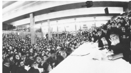
שהרי הוא המקום שממנו נובעים הזיתים.

כך גם בזמן המשיח: "ועמדו רגליו ביום ההוא על הר הזיתים" (זכריה יד, ד). - השמן משמש רמז לחכמה, זיתים הם מקור לשמן ואילו "הר הזיתים" הוא בדרגה נעלית יותר מן הזיתים,