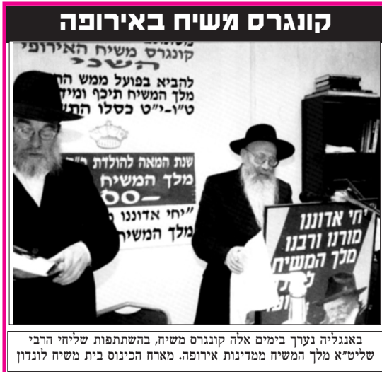
באנגליה נערך בימים אלה קונגרס משיח, בהשתתפות שליחי הרבי שליט"א מלך המשיח ממדינות אירופה. מארח הכינוס בית משיח לונדון

אומנם התברר כי מאז עלה ה"מ" לשלטון נרצחו כ-200 יהודים הי"ד ונפצעו מאות רבות (ה' ירפאם), אך כל זה אינו נוגע למי שגם אוסר לזעוק "עד מתי?! דורש את המשך הקורבנות למען חזונו - המדינה הפלסטינית (היל"ת).