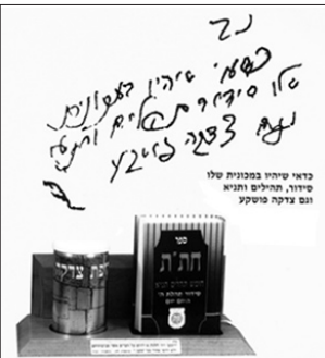
ערכת החת"ת וקופת צדקה

יהודה בצלאל, בעל חנות הלבשה במקום האירוע, מספר: "משהחלו