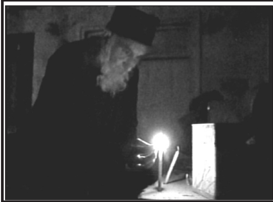
הדלקת נר חנוכה ראשון, ביום ראשון השבוע, לאחר חמש שנים של שלטון הטאליבן.