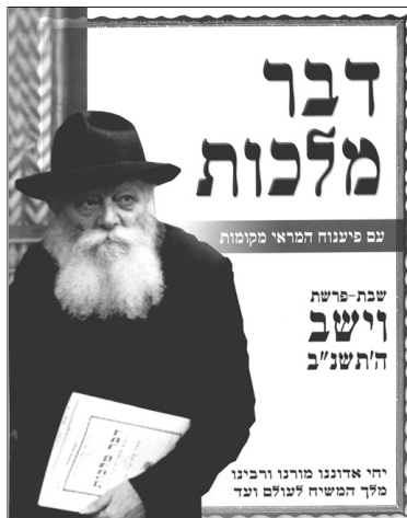
חזית ה"דבר מלכות" עם הפיענוחים

בשלב הבא מתוכננת אי"ה, הוצאתם לאור של החבורות לפרשת "בא" ו"משפטים". ניתן להשיג את החבורת בראש ובראשונה ב"770" וכן בכל ישיבות חב"ד בארץ הקודש ובריכוזי חב"ד. טל' לפרטים והזמנות באה"ק: 03-658-4633