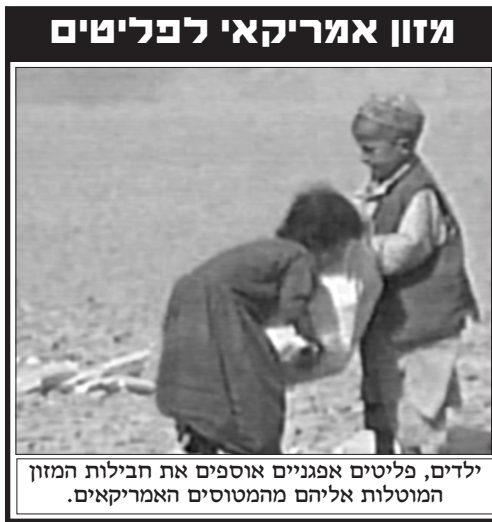
ילדים, פליטים אפגניים אוספים את חבילות המזון המוטלות אליהם מהמטוסים האמריקאים.

ואכן צילומים המגיעים מהשטח באפגניסטן מגלים כי במקביל להפצצות של יעדים צבאיים, מפעילים האמריקאים מערך "הפצצות חיוביות", הכוללים הטלת מזון, תרופות וביגוד לאוכלוסיה האזרחית הסובלת.