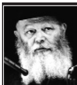
(שמחת תורה תשל"ו)