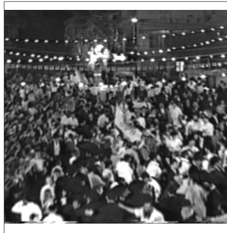
שמחת בית השואבה בבני ברק

היה זה מעמד בלתי שיגרתי לחלוטין, כראוי לימות המשיח. ואם למישהו נדרשה עדיין המחשה עד כמה הכל קולטים את בשורת הגאולה של הרבי שליט"א מלך המשיח, הרי שרבות היהודים שבאו לשמוח ודווקא עם משיח בגלוי, מעידים, שלכולם ברור שהפתרון היחיד הוא - משיח בן דוד ומתוך שמחה וטוב לבב.