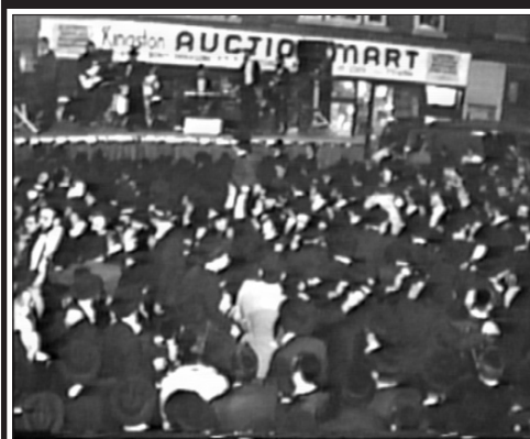
המוני הרוקדים בשכונה של הרבי שליט"א מלך המשיח, מי שהוציא את שמחת-בית-השואבה לרחובה של עיר.