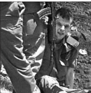
אחד מפצועי הפיגוע בקריה

ואז כמו ברק חלפה במוחי המחשבה "אתה לא עוצר כאן לנוח, הרי בדיוק על זה דובר בשיחה - שחייל יהודי עם נשק ואפילו בתל אביב הוא אינו בטוח, שלא