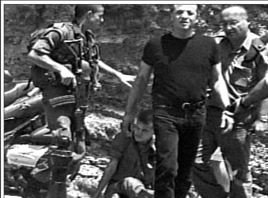
חייל פצוע מפגוע הירי השבוע, בשערי המחנה הצבאי בקריה. מי הוא האחראי לאיבוד כח ההרתעה של חיילי צה"ל?

מהם ונתנה לנו". אומנם, לדאבוננו, הרי אופן ההנהגה בארץ הקודש הוא להיפך ממש: לאחר כל נצחון שהקב"ה הנחיל ל"צבא הגנה לישראל", בנתנו להם שטחים של ארץ ישראל מתוך ניסים גלויים - מיהרו ה"פוליטיקאים" לשלוח "שליחים" להודיע ולהכריז על נכונותם ולרצונם להחזיר לגויים את שטחי ארץ ישראל שנתן הקב"ה..."