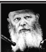
(כ"ה אייר תשמ"ה)