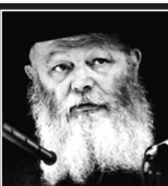
(כ"ה אייר תשמ"א)