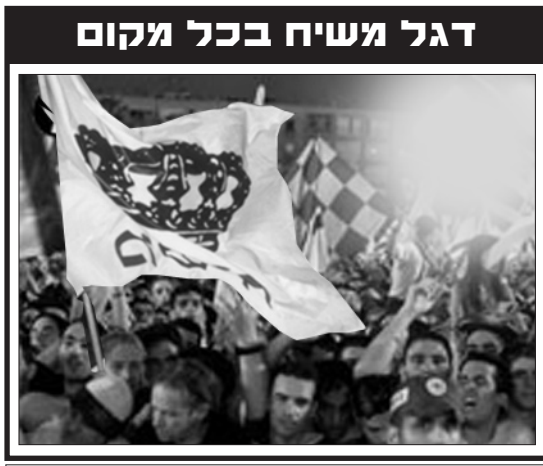
דגלי משיח, גם בכיכר רבין השבוע. באמת, גם החוגגים רצו משיח