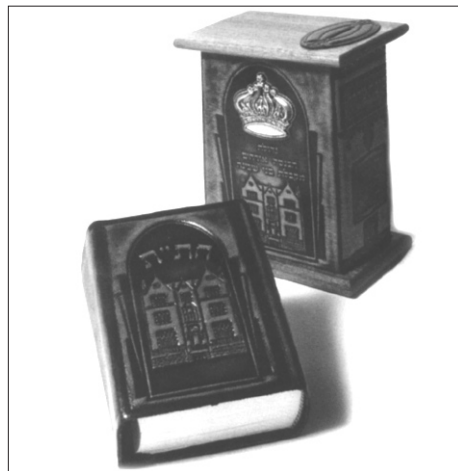
השי המיידי: ספר חת"ת עם קופת צדקה מהודרת

המעוניינים להצטרף יפנו בטל': 054-951-770.