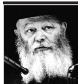
(ליל ג' תמוז תשמ"ב)

מצות הדלקת נרות השבת והחג מאירה את הנשמה ומזרזת את הגאולה, שנאמר: אם אתם משמרים נרות של שבת, אני מראה לכם נרות של ציון". מצות הדלקת נרות השבת והחג מאירה את הנשמה ומזרזת את הגאולה, שנאמר: אם אתם משמרים נרות של שבת, אני מראה לכם נרות של ציון". מגיל חינוך (שלוש שנים) מדליקות נר שבת וחג (נר אחד) וברכה.