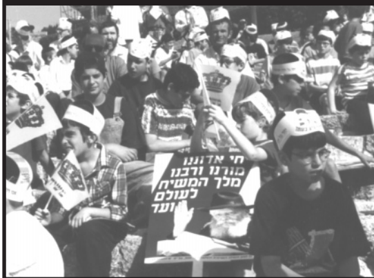
ילדים בכינוס ל"ג בעומר מתכוננים לתהלוכה, עם כובעי ודגלני משיח