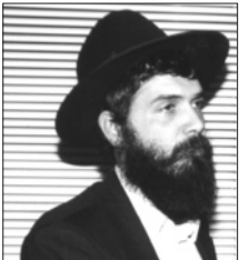
הרב אברהם בן שמעון

ונסיים בדברי הרבי שליט"א מלך המשיח: "לפיכך מבקשים בכל השלשונות של בקשה, כי כל אחד יסייע ויעסוק בעניין "הכנסת אורחים". ועל כל אחד לדעת כי אין הכוונה שמישהו אחר יעשה זאת, אלא הדברים מכוונים אליי".